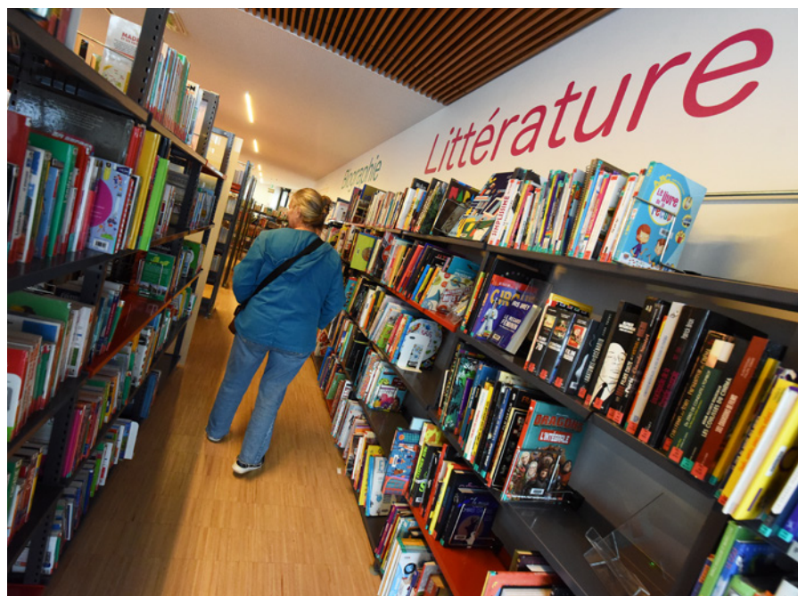
■ À la médiathèque Le Trapèze.